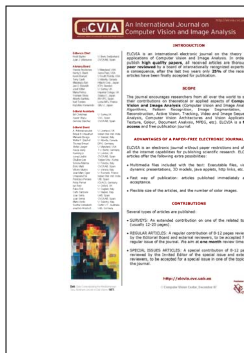
FIGURA 1. Full de mà

— Correus : Hi ha una llista de gent interessada en el tema, i elCVIA anuncia unes quantes activitats. Cada mes s'envia un correu electrònic a tots els subscriptors per anunciar publicacions noves i edicions especials. Els subscriptors poden seleccionar per un conjunt de paraules clau els subtemes què els interessin i el